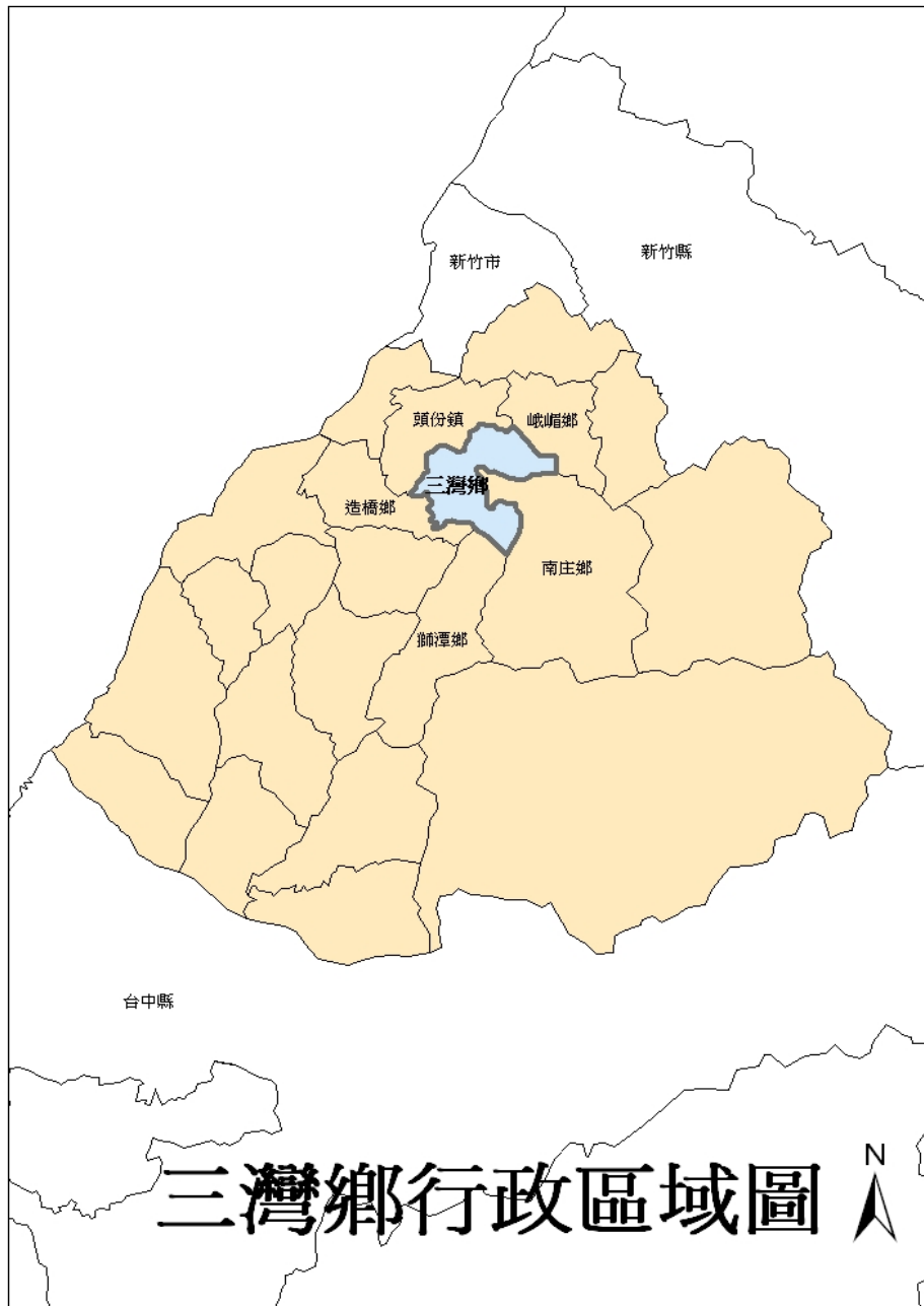
圖 3-2 三灣鄉行政區域圖