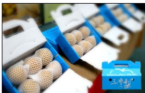
圖 4-2 三灣梨 2008 年產品包裝圖

近年來週休二日的因素，國人休閒活動興起，使得三灣梨在商品轉移的同時，市場也引導農民朝向觀光產業邁進。有農民將果園開放成觀光果園，結合地方特色以及定期舉辦三灣梨促銷活動，使得三灣梨產業與當地之農民由一級產業經營者跨越至三級產業經營者。圖二為三灣鄉 2008 年推出的三灣梨包裝與行銷。