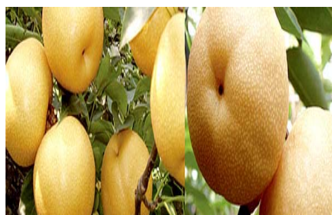
圖 4-3 三灣梨圖