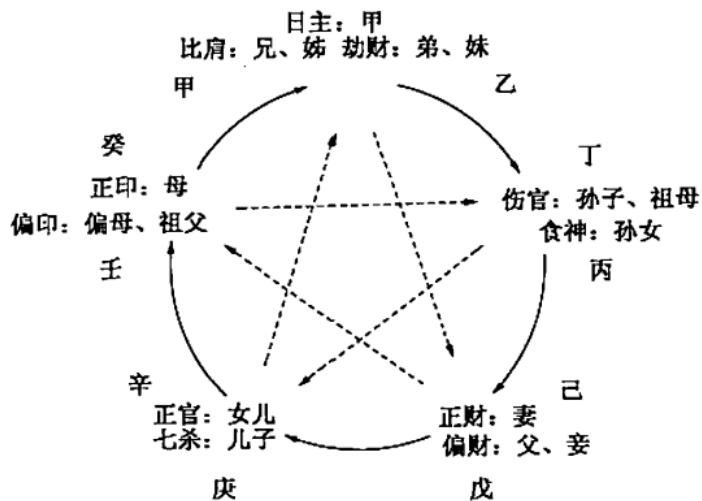
男命（甲日主）六亲网络（实线表示相生关系；虚线表示相克关系）

男命方面，《客家舊禮俗》所述唯一與《淵海子平》不同的在於孫子和孫女的分佈，這種差異有可能是地區差異，也有可能是作者參照了不同的底本。